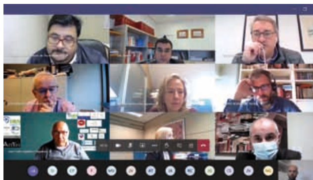
Reunión del grupo de trabajo estrategia para la rehabilitación energética de edificios en Asturias

En febrero se publicaron la memoria anual de la Demarcación de Asturias, diversas ofertas de empleo en la región, etc. ■