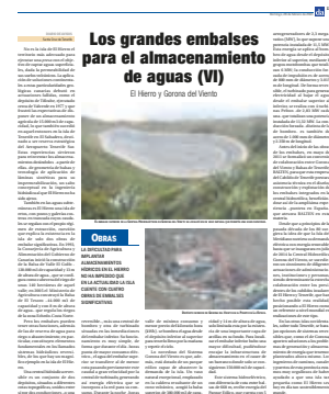
El Día 28 de febrero de 2021