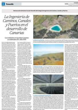
La opinión de Tenerife 17 de enero de 2021