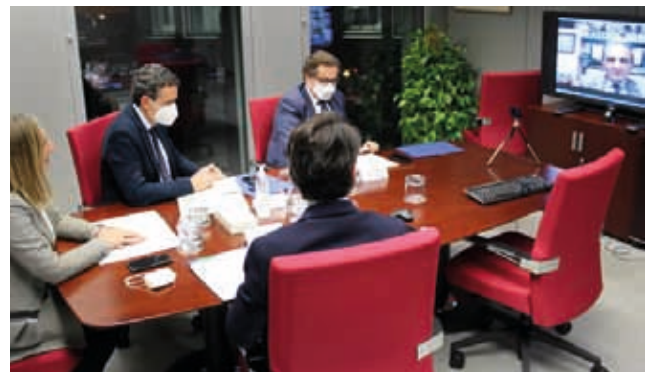
Reunión al más alto nivel entre el CICCPC y la Consejería de Fomento, Infraestructuras y Ordenación del Territorio