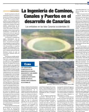
El Día 7 de febrero de 2021