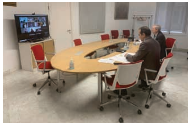
El Presidente y el Secretario General, durante la reunión con AIPE

Durante una nueva reunión de la Junta Directiva de AIPE, se comentan los enfrentamientos internos en el Área de los Ingenieros Industriales.