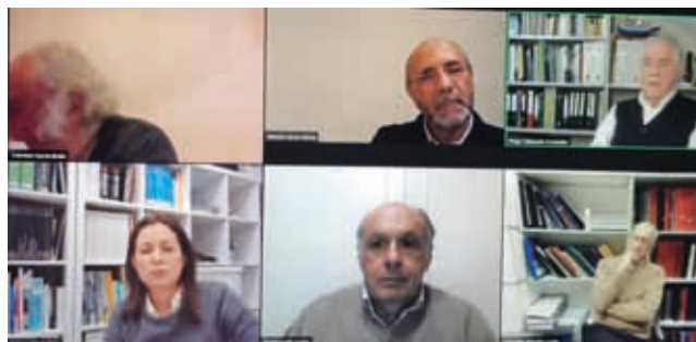
Jornada “Recorrido histórico por la configuración del paseo del Muro de Gijón”