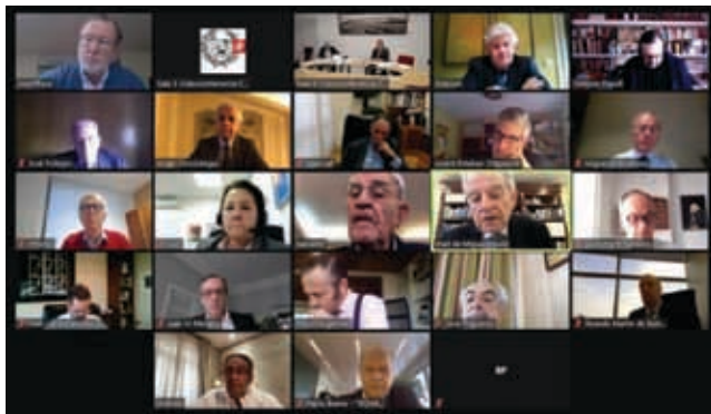
Patronato de la Fundación Caminos

A principios del mes de febrero tuvo lugar la reunión del Patronato de la Fundación Caminos, aprobando el Plan de Actuación para el 2021: Foro de Santander y Madrid, Becas, Premios Fundación y ThinkHub.