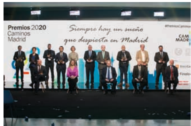
Foto de familia de los premiados

Esta edición se ha desarrollado, por primera vez, en un formato televisivo híbrido que ha combinado la emisión telemática por redes sociales con un aforo de asistentes reducido para garantizar todas las medidas sanitarias.