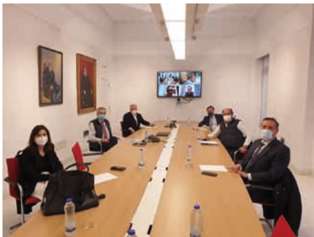
Constitución de la Comisión del Comité Asesor Inmobiliario del Colegio de Ingenieros de Caminos

Este comité pretende ser un foro permanente de debate y emisión de opinión sobre cuestiones inmobiliarias y urbanísticas. ■