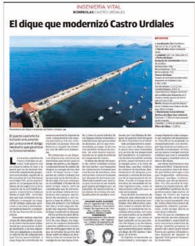
Artículo en el Diario Montañés

A lo largo del mes se ha continuado con el proyecto de difusión y prestigio de la profesión que constará de una serie de videos monográficos. ■