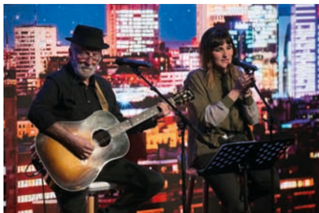
Actuación de Pancho Varona y Rozalen