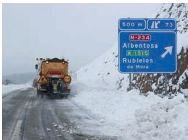
Quitanieves en una carretera de la provincia de Teruel

Las fotografías de este libro atestiguan la construcción de obras públicas como puentes, presas o carreteras y reproducen obras de gran valor