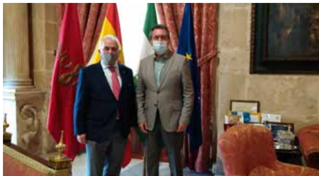
Reunión con el alcalde de Sevilla

materia de infraestructuras y transporte pendientes o en gestación en la ciudad. Entre ellas, entraron a analizar el paso de la SE-40 por el río a la altura de Coria del Río, el necesario enlace del aeropuerto con la Estación de trenes de Santa Justa, el comienzo de la línea 3 del Metro y la ineludible prioridad de completar la red sin más dilaciones, así como el trazado del Metro-Centro. Los dirigentes de la Demarcación y el Ayuntamiento quedaron emplazados a futuras citas para desmenuzar con la solicitada visión técnica estos y otros proyectos que vertebrarán Sevilla. ■