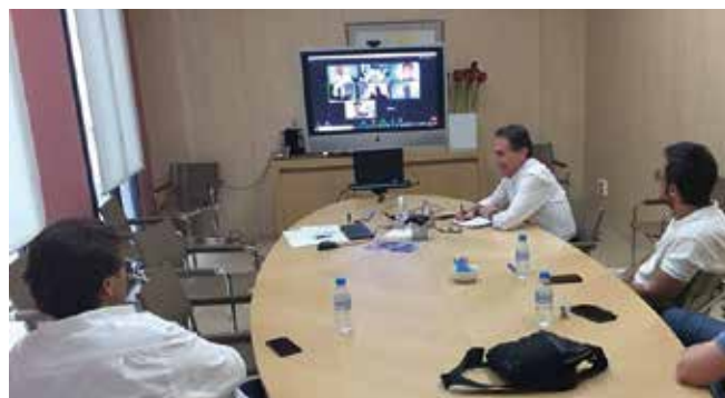
Reunión de la Junta Rectora de la Demarcación

de grandes proyectos”, dentro del Consejo Cívico para la recuperación social y económica del municipio como consecuencia del COVID-19. Ese mismo día, se celebró una reunión presencial y por videoconferencia de los miembros de la Junta Rectora de la Demarcación.