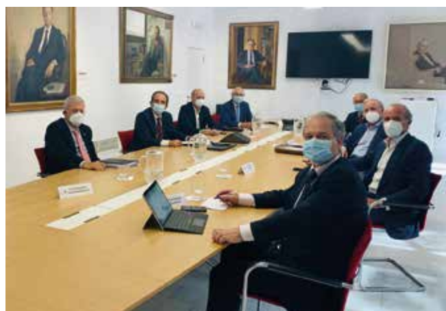
Reunión de la mesa del Observatorio de la Inversión de Obra Pública