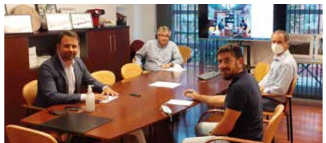
Reunión Grupo Parlamentario Popular