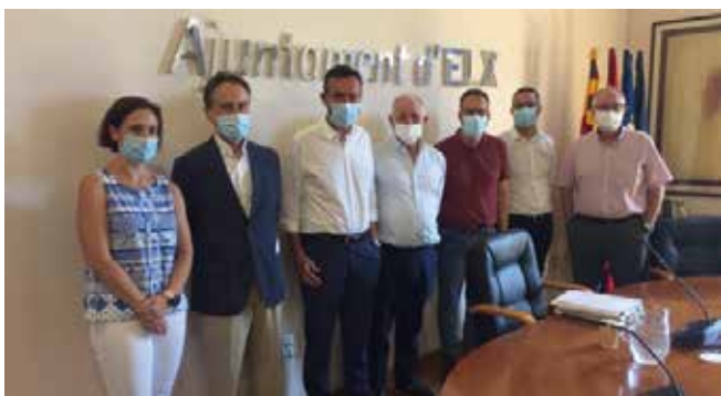
Reunión en el Ayuntamiento de Elche