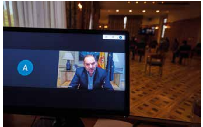
El ministro participó en el curso de manera telemática

Asimismo, en el MITMA trabajan en la “Estrategia de Movilidad Sostenible y Conectada”, que “está claramente orientada con el espíritu reformista y modernizador del Plan Europeo de Recuperación Económica”. Así, buscan avanzar en la movilidad como un derecho de todos, al tiempo que se debe afrontar la emergencia climática y abandonar progresivamente los combustibles fósiles; abordar las crecientes exigencias de la sociedad en materia de transparencia y seguridad (en las que ahora cobra fuerza la componente de seguridad sanitaria); atender los nuevos usos sociales y pautas de movilidad de la población; aumentar la competitividad de la economía y su productividad en un contexto internacional cambiante,