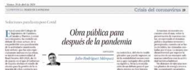
Artículo de opinión