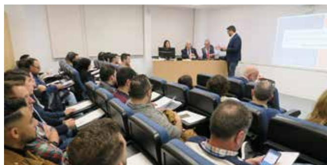
Charla EPS Algeciras

Toda la información en: http://caminosandalucia.es/los-representantes-de-la-demarcacion-acercan-a-los-alumnos-de-la-eps-algeciras-sus-opciones-al-salir-de-las-aulas-y-los-servicios-del-colegio/