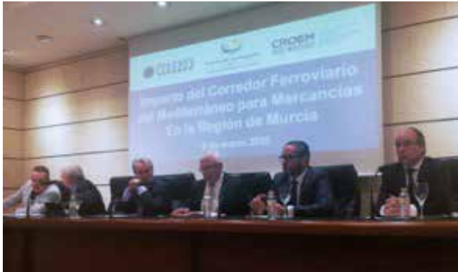
Jornada sobre el impacto del Corredor Mediterráneo

• El pasado 6 de marzo se celebró una Jornada auspiciada por FERRMED y CROEM para tratar el Impacto del Corredor Ferroviario del Mediterráneo para Mercancías y su interconexión con el corredor hacia Madrid y su continuidad hacia Andalucía, en la Región de Murcia.