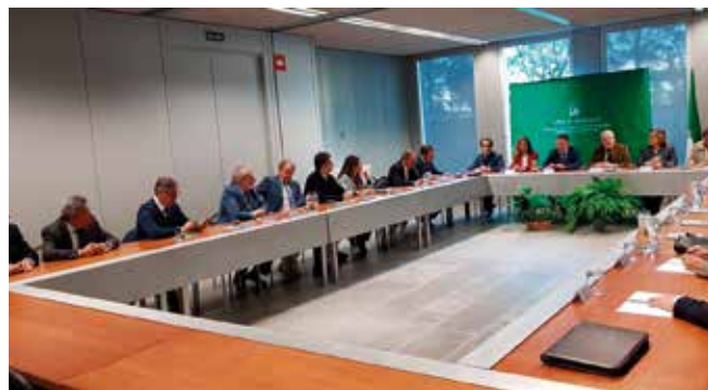
Reunión con la Consejería de Fomento

Toda la información en: http://caminosandalucia.es/el-sector-en-andalucia-pide-acabar-con-las-bajas-de-precios-en-licitaciones-y-proyectos/