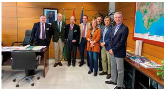
Reunión de Asian con Medio Ambiente

Más información en: http://caminosandalucia.es/los-colegios-de-ingenieros-apuestan-por-la-simplificacion-normativa-en-medio-ambiente/