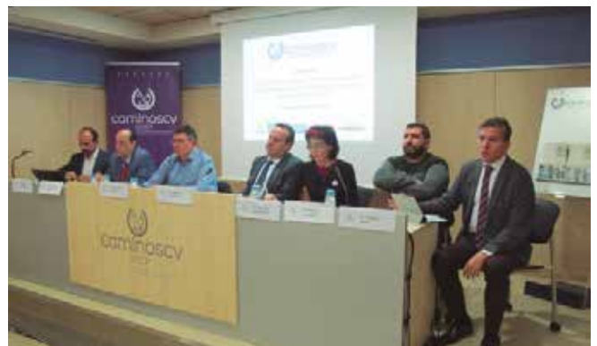
Jornada sobre la AP-7