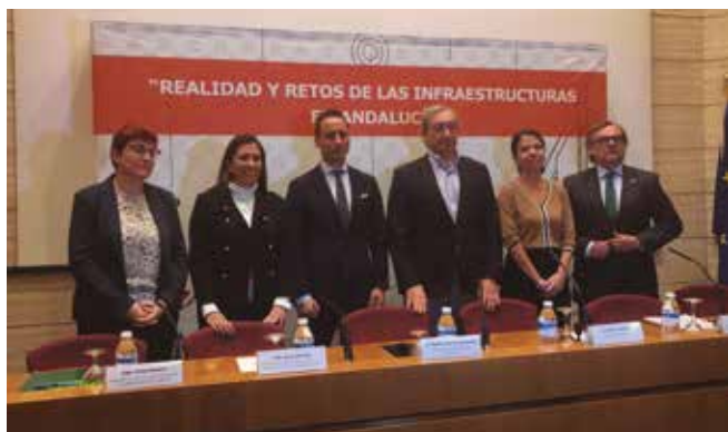
‘Realidad y retos de las infraestructuras en Andalucía’

La presidenta de Ceacop volvió a recordar como gran reto futuro la inversión en infraestructuras relacionadas con el saneamiento y la depuración de aguas, subrayando la existencia de unos 600 millones de euros recaudados por medio del canon andaluz que siguen sin destino mientras llueven las multas de Europa desde 2015 por incumplir el vertido cero.