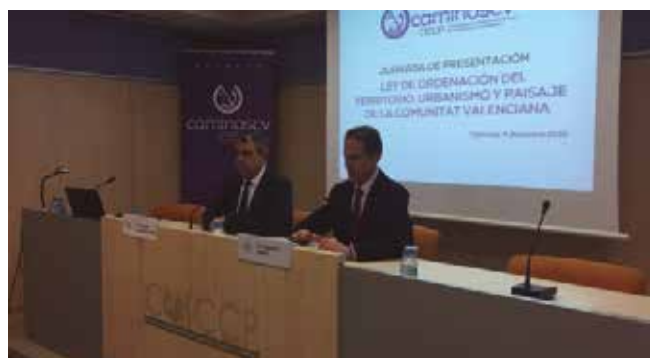
Presentación en Valencia

• El día 4 tuvo lugar la celebración en Valencia de la Jornada de Presentación de la Ley de Ordenación del Territorio, Urbanismo y Paisaje de la Comunitat Valenciana.