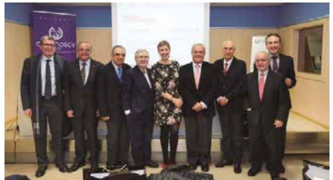
Entrega de placa por 50 años en Valencia

• El día 16 se celebró una reunión, en Valencia, de los miembros de la Junta Rectora de la Demarcación. También tuvo lugar la celebración en Valencia del acto de celebración de las fiestas navideñas, con la entrega de Insignias a los recién colegiados y placas a los compañeros de 50 años de profesión.