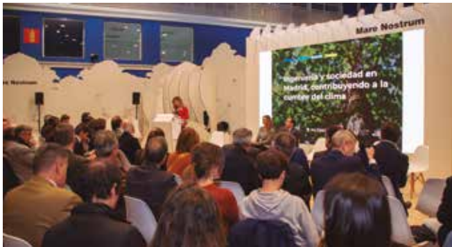
Jornada durante la celebración de la COP25