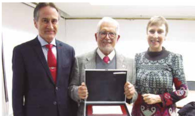
Entrega de placa por los 50 años de profesión en Alicante