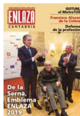
Revista Enlaza Cantabria

• A comienzos del mes de diciembre, la Demarcación de Cantabria lanza el quinto número de su revista oficial ‘ENLAZA Cantabria’. En esa edición, la publicación hace un repaso a las últimas actividades realizadas por el Colegio, haciendo especial hincapié en la entrega del Emblema ‘ENLAZA Cantabria’ al exministro Íñigo de la Serna. Además, se interesa por el trabajo que realiza el Grupo de Ordenación del Territorio, Urbanismo y Movilidad (GOTUM), detalla la obra de acceso al Puerto de Raos por la A-67, mantiene el espacio dedicado a la Escuela Técnica Superior de Ingenieros de Caminos, Canales y Puertos de la Universidad de Cantabria y rinde homenaje a Pepín Revilla, entre otros temas de interés.