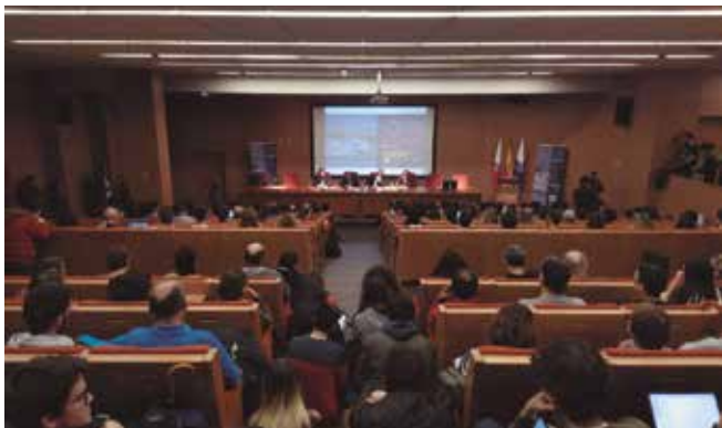
‘Situación actual y perspectivas sobre el cambio climático en Cantabria’