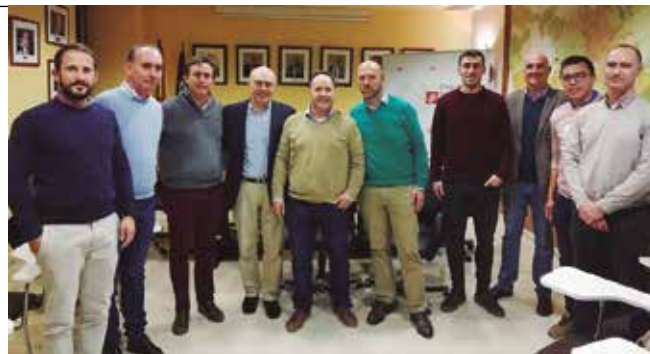
Clausura del I Programa Mentor de la Demarcación

• El 17 de diciembre tuvo lugar la última reunión y la clausura del I Programa Mentor desarrollado en la Demarcación de Murcia, con la asistencia de todos los participantes en el mismo, que realizaron un balance muy positivo de esta experiencia, y expresaron su deseo de continuar con sucesivas ediciones de esta iniciativa que permite a los colegiados más veteranos iniciar a los recién llegados al Colegio, en los entresijos del ejercicio de la profesión.