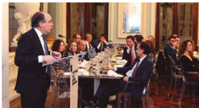
Cena de Navidad

Tras la alocución navideña del Decano a los asistentes, se realizó la tradicional bienvenida a los colegiados asistentes por primera vez a la Cena de Navidad, algunos de ellos recién colegiados. Como colofón, se procedió al sorteo de los distintos obsequios entregados por las entidades colaboradoras.