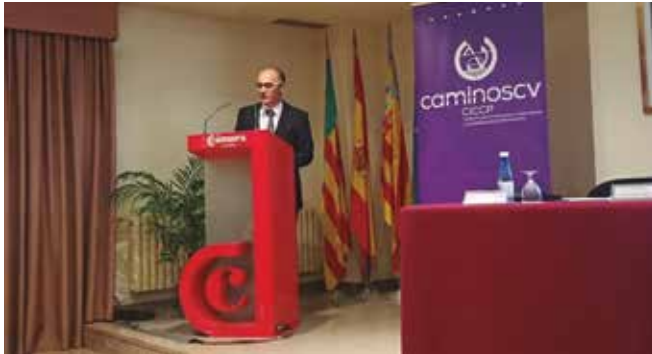
Jornada sobre el sistema de explotación Mijares