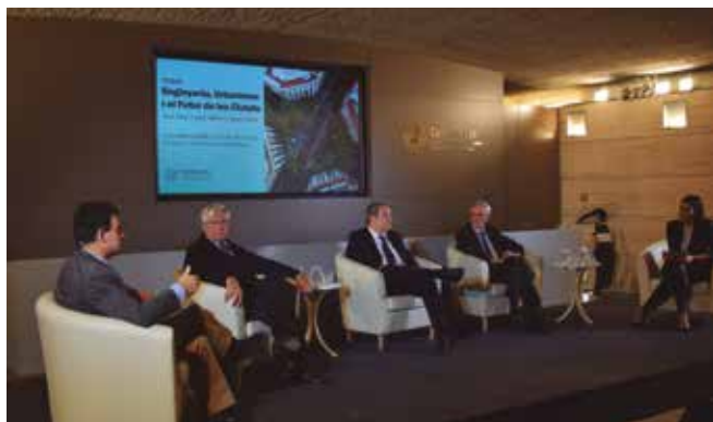
Debate 'Ingeniería, urbanismo y el futuro de las ciudades'