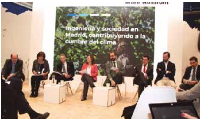
Panel de expertos

• También se contó con un panel de expertos para abordar diferentes aspectos del papel de la ingeniería de Caminos en la lucha contra el cambio climático y su adaptación al mismo.