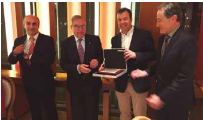
Entrega de placa por 50 años en Castellón

• El 14 de diciembre tuvo lugar la excursión de senderismo a Rambla Ripia (Cortes de Pallás); así como la celebración en Castellón de la cena con motivo de celebración de las fiestas navideñas 2019, con la entrega de placa al compañero de 50 años de profesión.