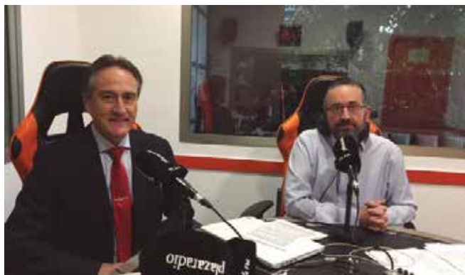
Entrevista en la radio

del acto de celebración de las fiestas navideñas 2019, con la entrega placa al compañero de 50 años de profesión. ■