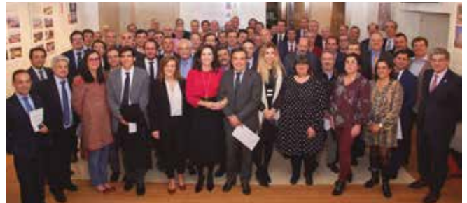
Colegiados en su 25º aniversario de profesión

• Entre otras actividades de la Demarcación de Madrid, el 11 de diciembre se celebró el acto de homenaje a los colegiados de la promoción de 1994 por su 25º aniversario de profesión.