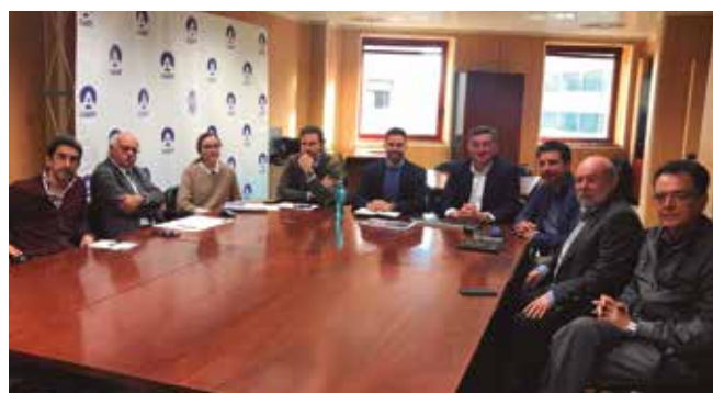
Clausura del I Programa Mentor de la Demarcación

• La semana pasada miembros de la Junta Rectora de la Demarcación de Tenerife se reunieron con el Consejero y el Gerente del Consejo Insular de Aguas de Tenerife (Cabildo de Tenerife), para informarles del trabajo que está desarrollando nuestro Colegio en relación a los criterios considerados y empleados a la hora de realizar los cálculos de inundación marina y pluvio-marina. ■